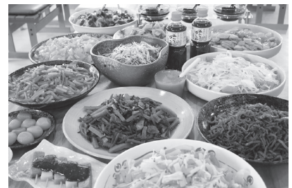
こんにゃくパーク