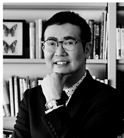
福岡 伸一 氏 (ふくおか しんいち／青山学院大学 教授)