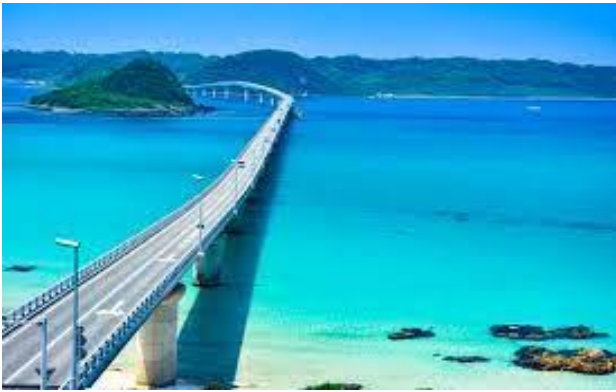
角島大橋: イメージ ※当日の天候により景観が写真と異なります。