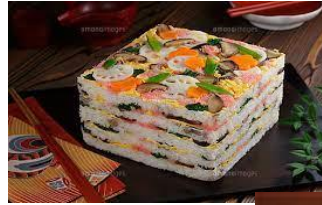
岩国寿司:イメージ