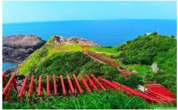
元乃隅神社: イメージ