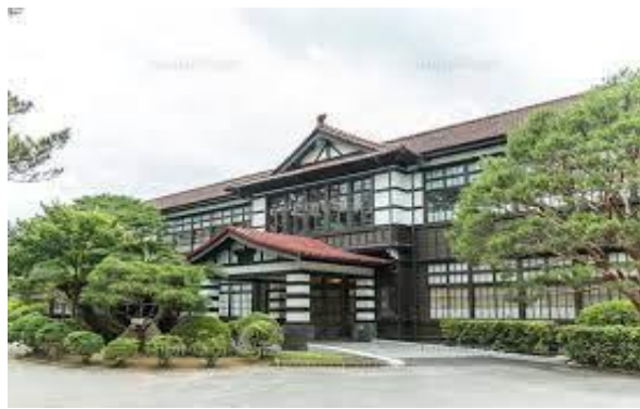
明倫学舎:イメージ