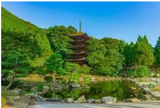
瑠璃光寺:イメージ