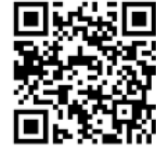
『大会参加・各種申込システム』

※上記URL・QRコードより、申込システムへ接続してください。大会HPからも接続可能です。 4月13日(水)正午より、ご登録可能です。