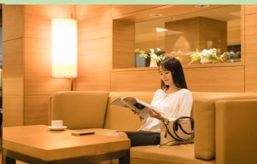
チェックアウト は11:00♪

旅行条件＜要約＞ 詳しい旅行条件を説明した書面をお渡ししますので、事前にご確認の上お申込みください。本旅行条件書は、旅行業法第12条の4に定める取引条件説明書面及び同法第12条の5に定める契約書面の一部となります。この条件に定めのない事項は、当社旅行業約款（募集型企画旅行契約の部）によります。