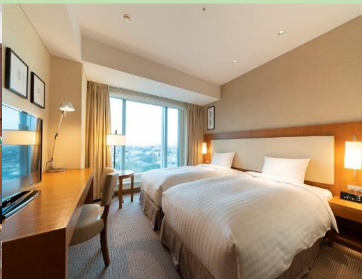
開放感あふれる 客室♪

□■宿泊者専用ラウンジがあり、 無料でコーヒー・紅茶・ソフトドリンクをお楽しみいただけます。 (11:00~22:00)■□