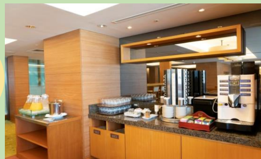
チェックインは 14:00~ ※最終は24:00

□■宿泊者専用ラウンジがあり、 無料でコーヒー・紅茶・ソフトドリンクをお楽しみいただけます。 (11:00~22:00)■□