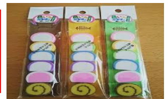
掲載写真: 箱根湯本天成園(イメージ)