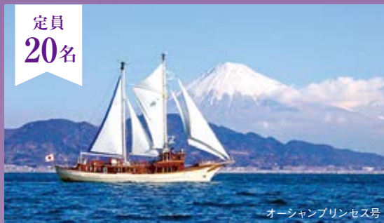
オーシャンプリンセス号